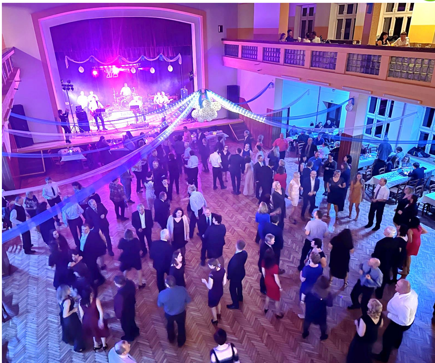
Tradiční obecní ples.